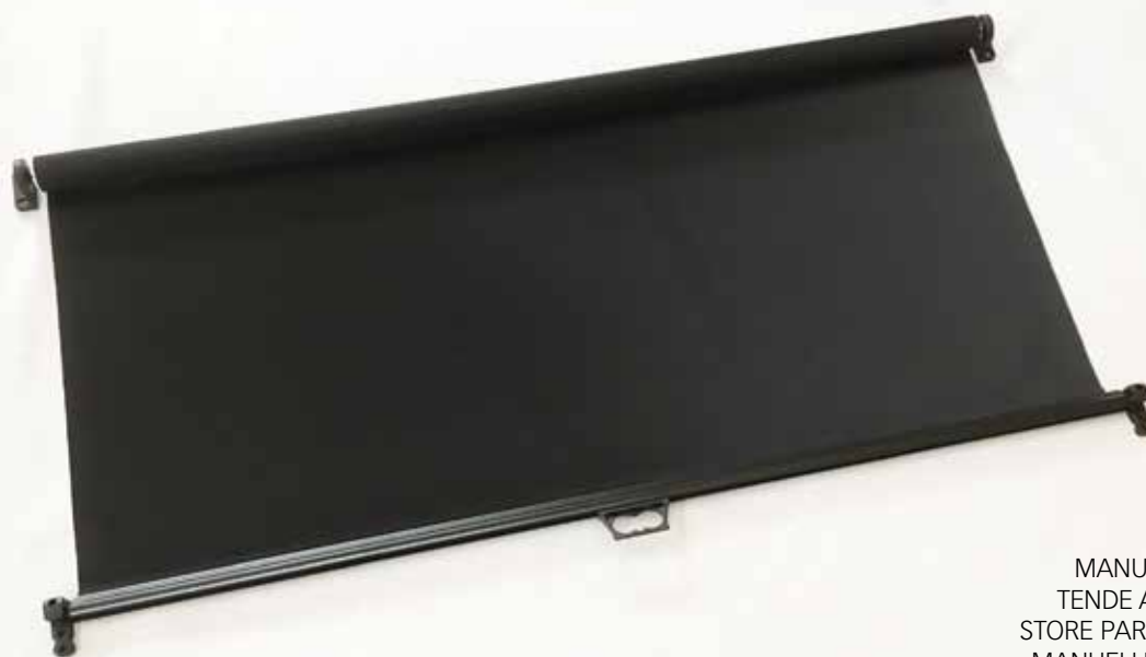
MANUAL ROLLERBLINDS TENDE A RULLO MANUALI STORE PARE-SOLEIL MANUEL MANUELLE SONNENROLLOS